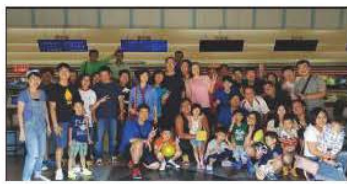
健康促進_LCY家庭日_保齡球

整體成績部分：2013-2015 年 BMI 值異常比例呈現逐年增加，不降反升的負成長，由其以 BMI 值 (24~27) 與 (27~30) 之區間，卻以每約 2% 之異常比例成長，且在 2015 年達最高峰，佔全廠異常比達 56.5%，顯示健康促進推動並未有實質之成效。基於管理系統持續改善之精神，於年度管審會議檢討時，管理階層持續鼓勵並提供資源，再結合外部資源諮詢與協助，採取多元化並進及加強宣導再教育等強化措施，終於展現於 2016 年之成績，BMI 值 (24~27)、(27~30)、(30~35) 等區間之異常率均下降至次優成績 (僅次於 2013 年)，顯示逐年推動之成效，有了潛移默化之成效。